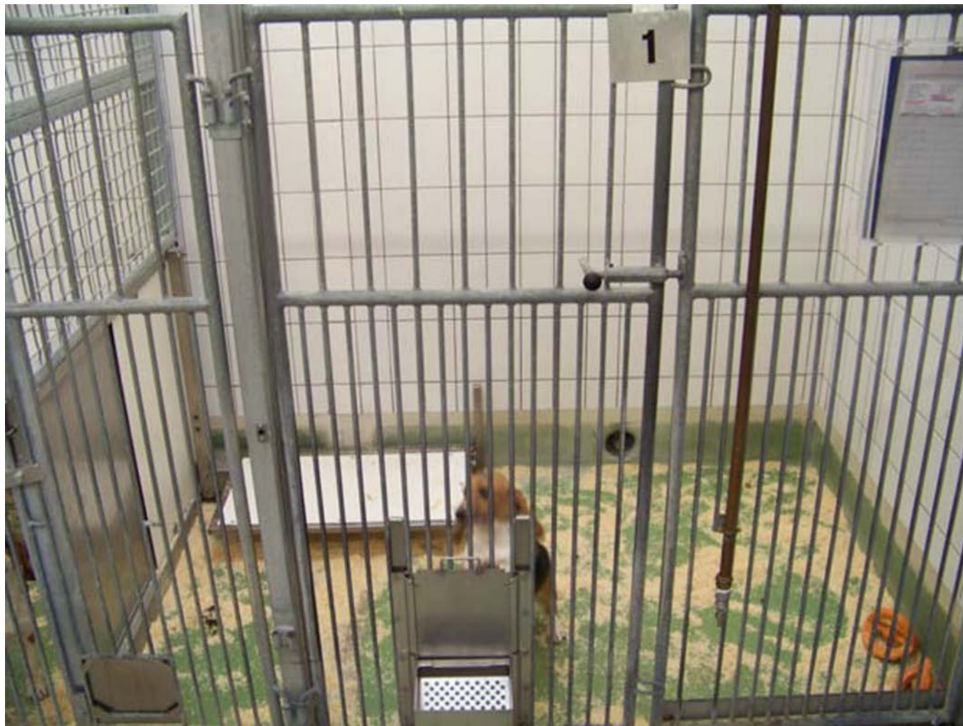
Observation devant la cage

Ensuite, des médicaments antipsychotiques sont injectés pour calmer les Beagles agités: Haldol, Risperdal et l'Olanzapine.