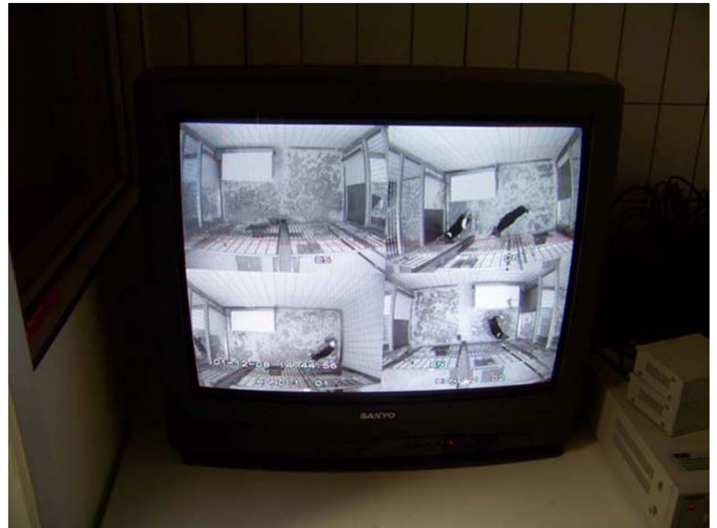
Observation par caméra de surveillance

CAV ne renoncera jamais à la lutte contre cette souffrance insensée des animaux. En 2008, quand nous avons révélé que le laboratoire de Philip Morris à Louvain testait les effets nocifs de la fumée de cigarette sur des animaux, le tollé général a été massif. Il n'a donc pas fallu longtemps avant que les tests pour produits de tabac sur animaux ont été interdits par la loi. Faire des tests sur animaux avec des cigarettes ou d'autres substances addictives, il n'y a aucune «norme éthique» pour justifier ce genre de pratiques !